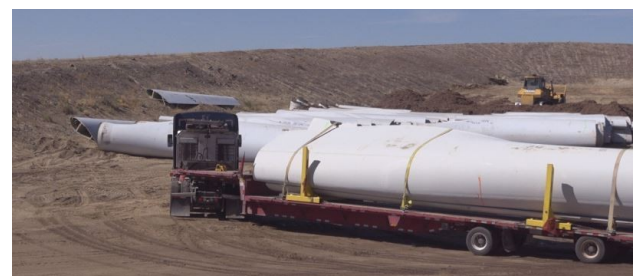
de turbine vers le site d'enfouissement régional de Casper en vue de son élimination.

Pour gagner de la place, ils coupent chaque lame en trois parties distinctes avant de les transporter, puis les empilent les unes sur les autres pour les enterrer. Ces pales sont vraiment grandes et occupent beaucoup d'espace aérien. Notre zone non délimitée est très grande et elle va pour durer des centaines d'années ». Extrait de la traduction faite avec Google